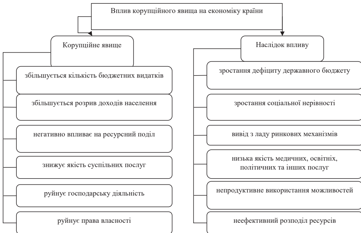
Рис. 1. Вплив корупційних явищ на економічний розвиток держави

В Україні і досі функціонує формальний підхід до всього процесу боротьби з корупцією,